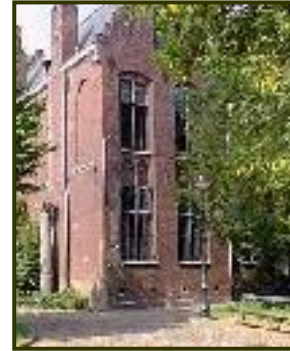
Binnenkoer v/h Oud-Hospitaal te Aalst Oost-Vlaanderen.