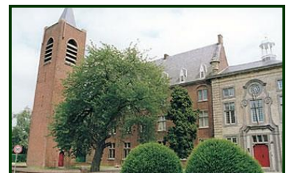
Abdij van Affligem.

[20 - Watermolenpachters, jrg XXV 1997/3 blz. 142, 155 en 156]